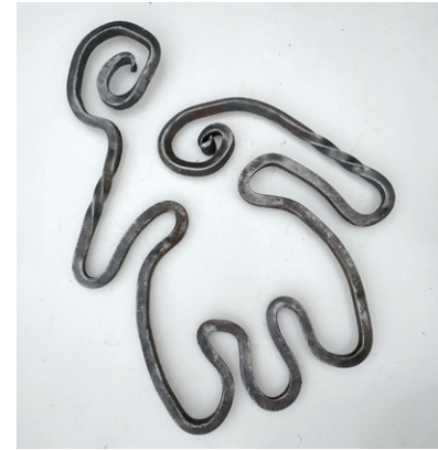
Arbeiten von Kursteilnehmer:innen